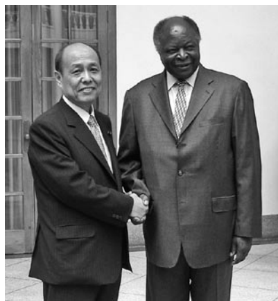
ケニア大統領府にて(キバキ大統領と)

た。キバキ大統領は、アフリカのリーダーらしく、風格のある人物で威厳のある風貌であった。大統領は、「日本に色々な面で協力してもらい感謝している。日本との友好関係を維持していきたい。ケニアの国をもっと見てもらいたい」と歓迎の言葉を述べた。それに対して、矢野委員長は「来年のアフリカ開発会議には安倍首相も大きな期待を持っている。会議の成果をその直後に日本で開催される先進国首脳会議(サ