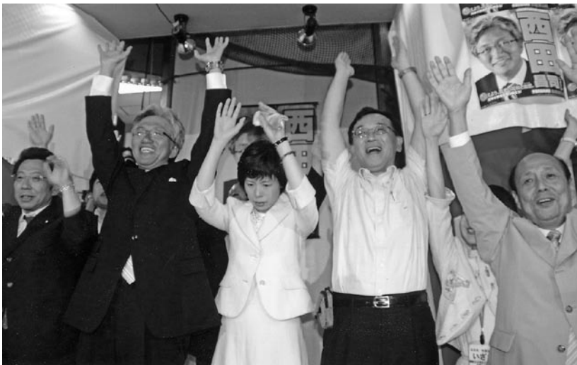
喜びに沸く西田選挙事務所にて