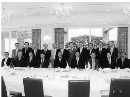
フン・セン首相、カンボジア政府要人と参議院議員

カンボジアのフン・セン首相は1998年に首相に就任、経済発展のために諸改革を実行している。わが国はカンボジアの和平・復興・開発に積極的に貢献し、1992年には初のPKO(国連平和維持活動)の要員も派遣した。そのため、カンボジアのわが国に対する信頼は非常に強いものがある。政府の公賓として、6月13日(16日の日程で日本を訪れたカンボジアのフン・セン首相は、6月14日、ホテル・オークラで開かれた参議院外交調査会主催の朝食会に出席し、今後の両国の友好協力関係について調査会の各議員と意見を交わした。